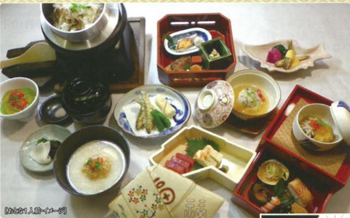
【おとこ一人前イメージ】